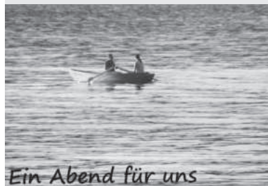
Ein Abend für uns