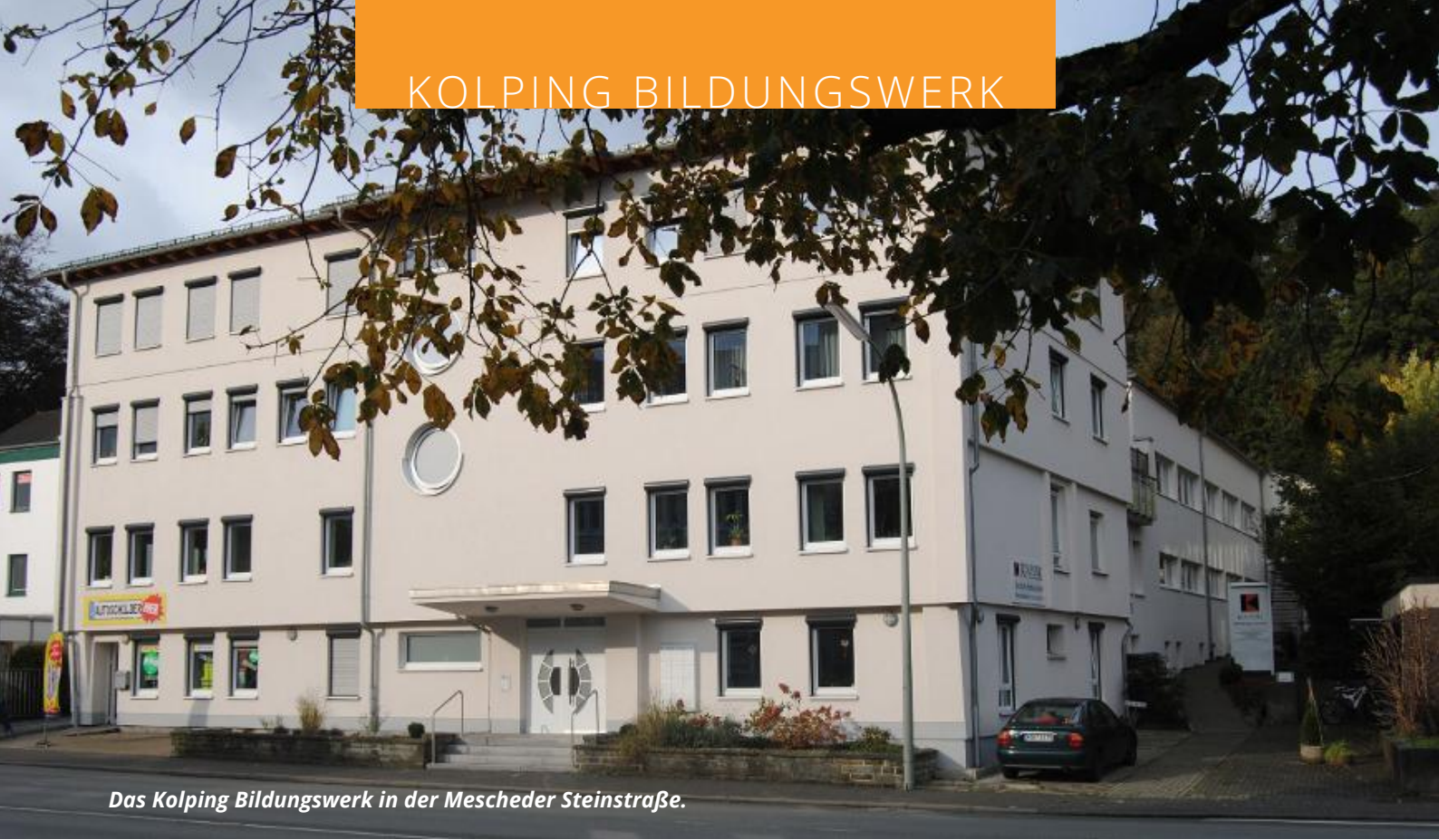
Das Kolping Bildungswerk in der Mescheder Steinstraße.